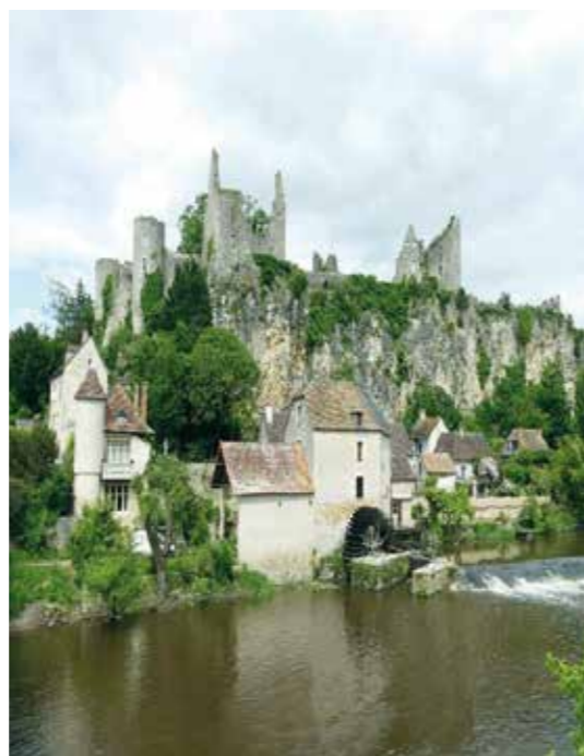
Village d'Angles sur Anglin