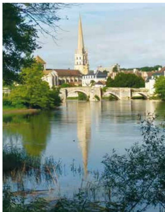
Abbaye de Saint-Savin